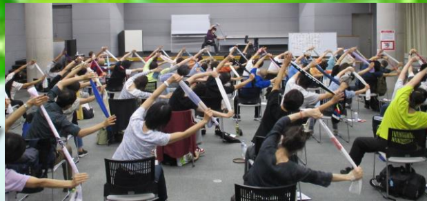
※前回の講習会風景