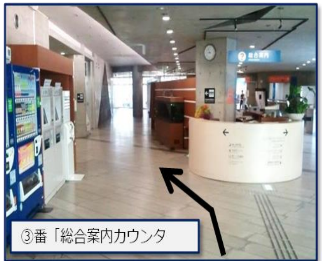
③番「総合案内カウンタ