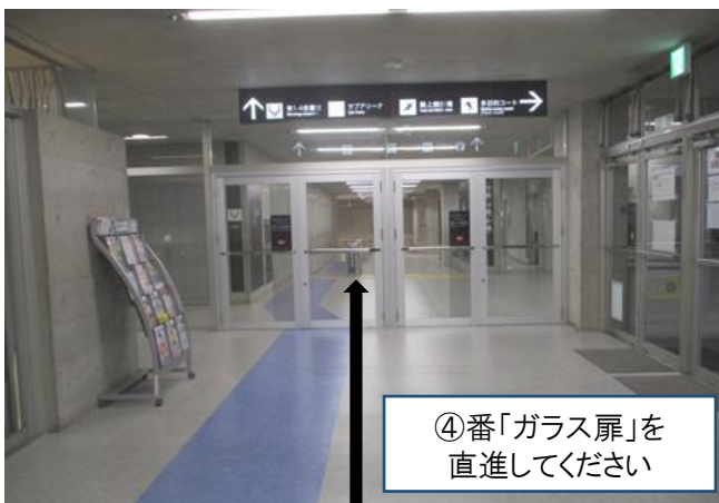
④番「ガラス扉」を 直進してください